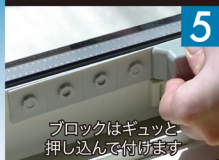
ブロックを押し付けはめる