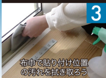
設置面の汚れを拭き取る