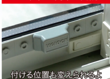
ロック位置も簡単に開調整