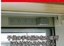
サッシ天側設置で安心