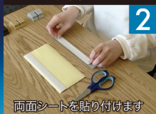
ベースに両面テープを貼る